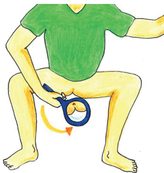
Skica 1: Opazovanje zadnjika z ogledalom

Večina sprememb, ki jih bomo opazili, so nenevarne kožne gube zunanjih hemoroidov.