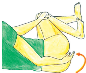
Skica 2 a: Leže na boku