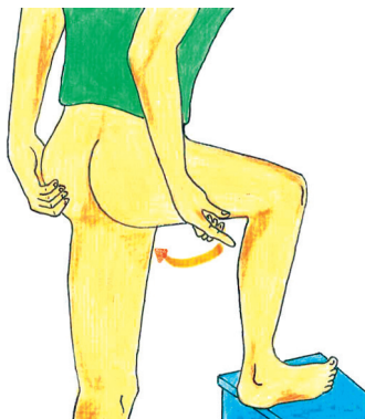
Skica 2 c: Stoje s podprto nogo npr. na pručki ali banji