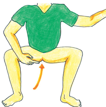
Skica 2 č: Čepe ali sede npr. na bideju, banji